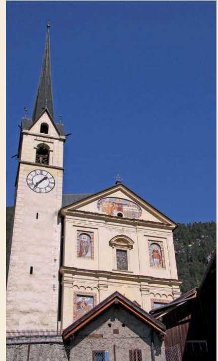
Alvaneu Dorf am 17. September um 10.30 Uhr.