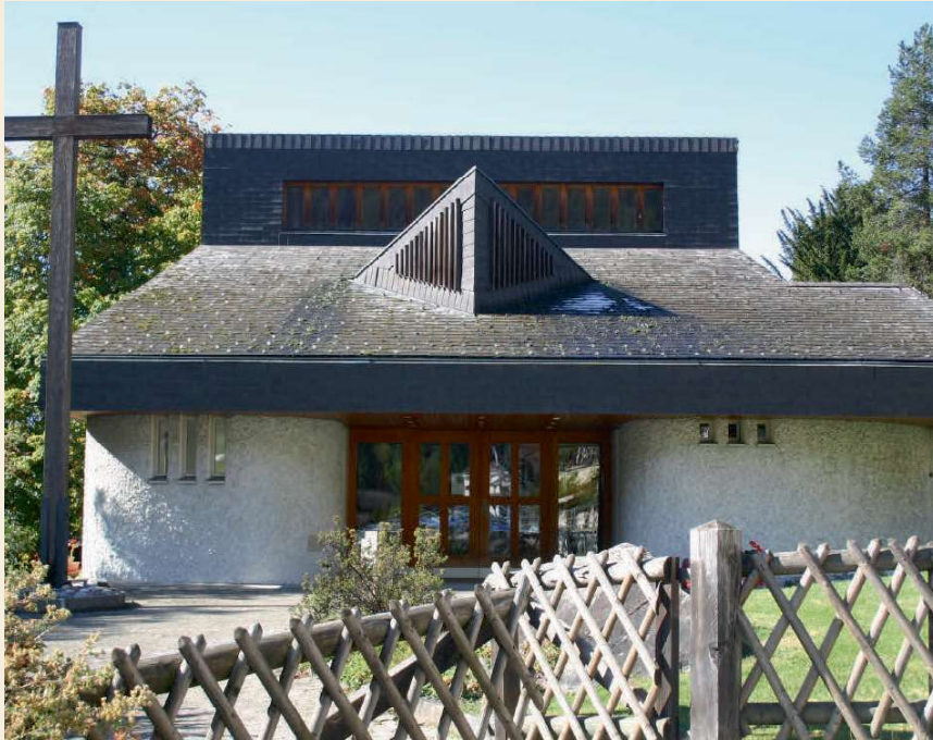
Filisur am 16. September um 19 Uhr.