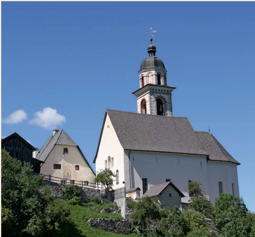
Mon am 24. September um 10.30 Uhr, mit Vocal Ensemble Albula, Messe von Pompeo Cannicciari, Messa in A.