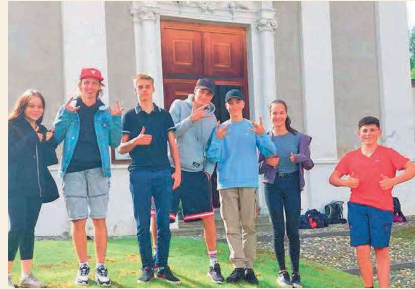
Firmlinge in Zivil.