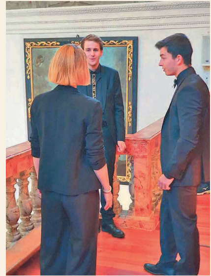
Drei Mitglieder des Chores Incantanti.