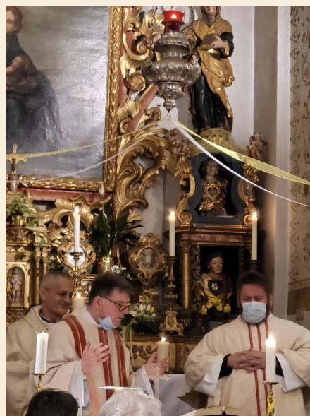
Josefsnovene in Alvaschein

Der Monat März war für die Pfarrei-Gemeinschaft im Albulatal spirituell sehr reichhaltig. Denken wir an das Fest des